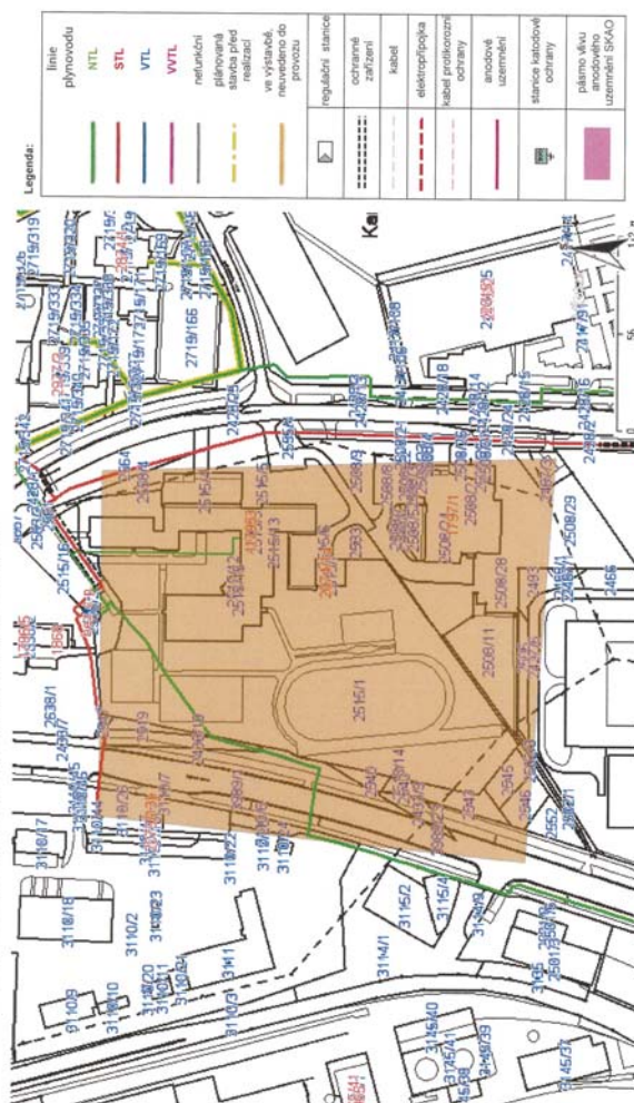
Příloha: Orientační zakres plynárenského zařízení. Tato příloha je nedílnou součástí stanoviska č. 5001756441 ze dne 27.07.2018.

Provozovatel DS: GasNet, s.r.o.; Stavebník: ADEA projekt s.r.o., Kufkova 1133/10, 70200 Ostrava, K.č.: Karviná-město.